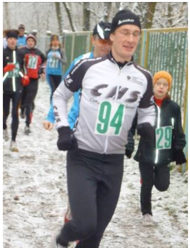
Das Feld formiert sich