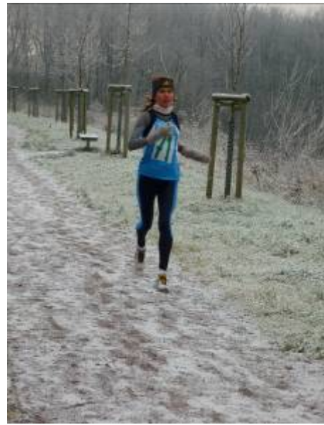
die erste Frau und Gesamtdritte