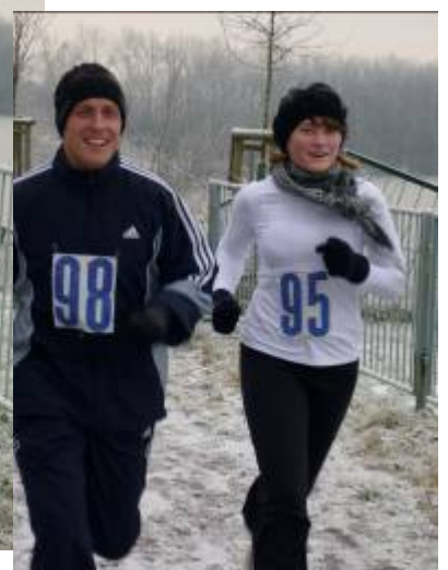
sowie Vater und Tochter