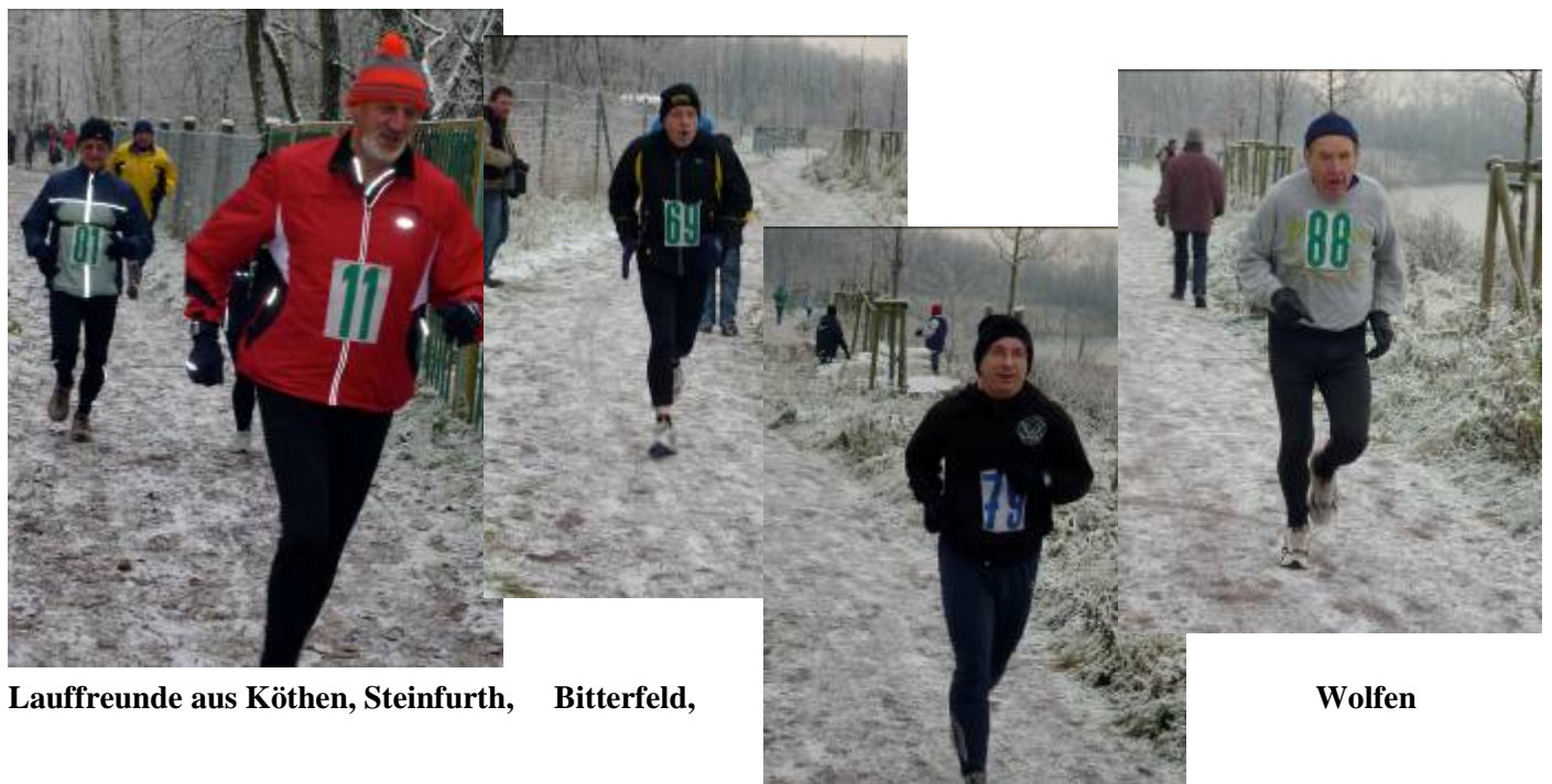
Lauffreunde aus Köthen, Steinfurth, Bitterfeld,