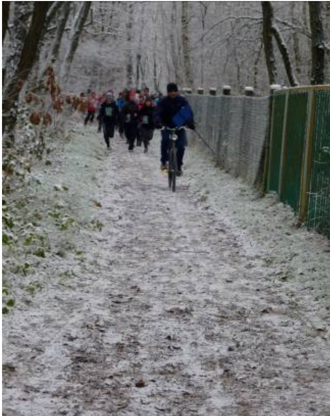
Nach dem Start mit bewährtem Führungsfahrzeug