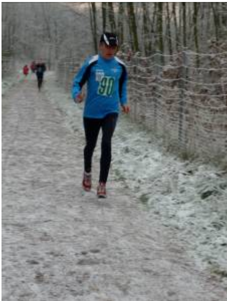
der dritte Mann