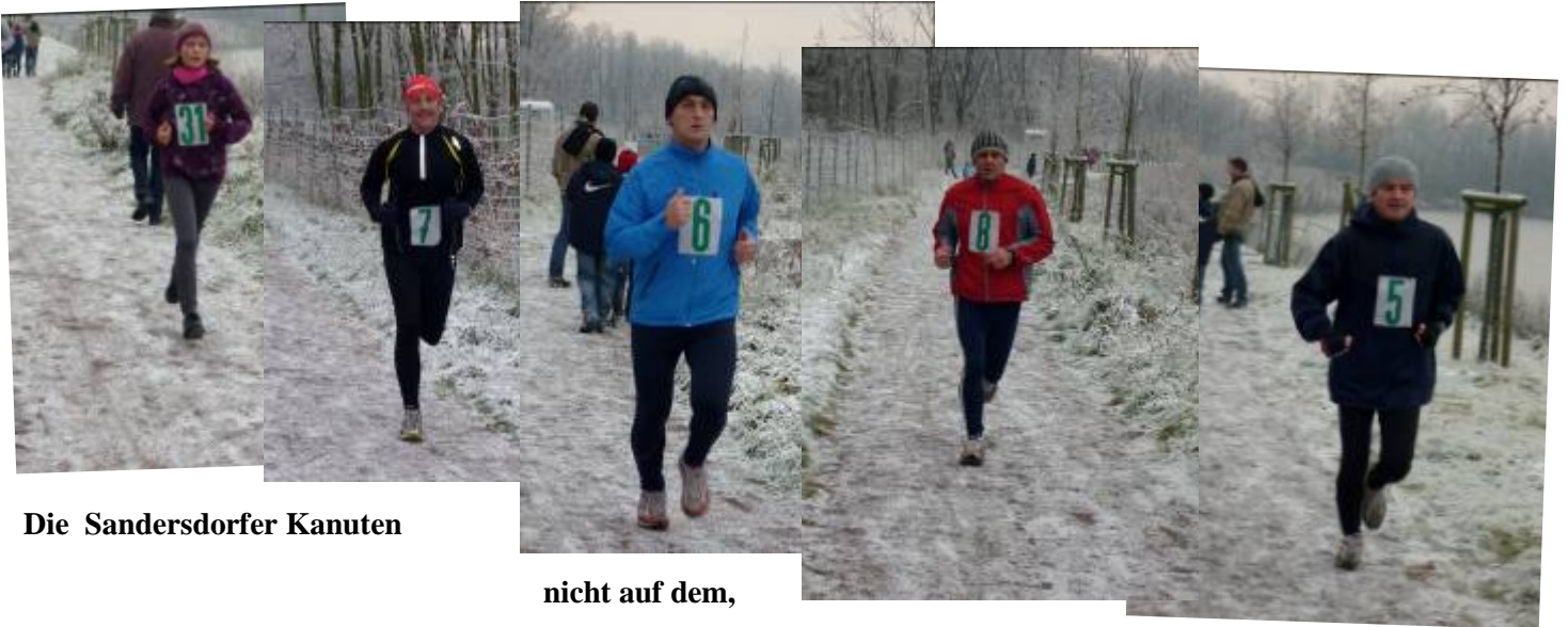
Die Sandersdorfer Kanuten